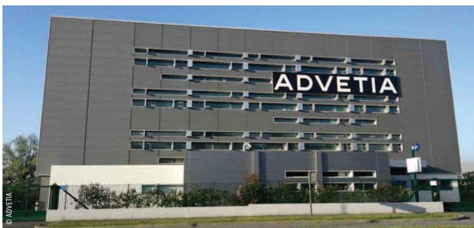
Imposant bâtiment de quatre niveaux et de 2 000 m 2 , le CHV Advetia a été inauguré en 2018.

Centre de spécialistes travaillant en synergies pluridisciplinaires, Advetia élargit son champ d'activité (chirurgie orthopédique, cardiologie, oncologie, gestion de la douleur, etc.) en devenant un CHV, et sa surface, en déménageant à Vélizy (Yvelines).