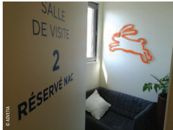
Salle de visite réservée aux nouveaux animaux de compagnie (NAC)... à la détente et au calme.