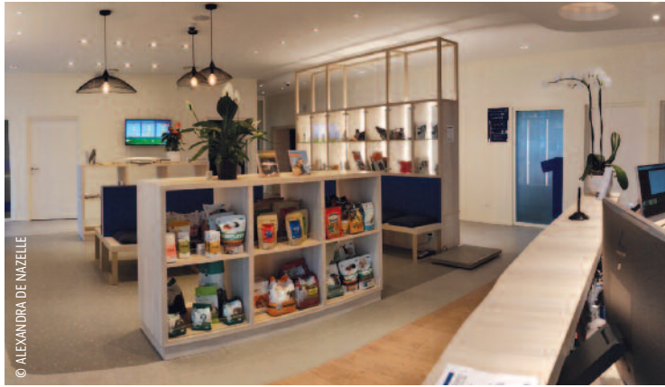
La salle d'attente, espace sobre et harmonieux, est habillée d'un mobilier design et baignée de lumières douces.