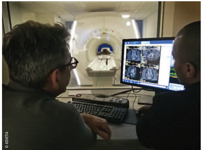
Pour son installation à Vélizy, Advetia se dote d'un nouvel IRM haut champ (ci-dessus) et d'un nouveau scanner haute définition.